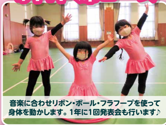
音楽に合わせてリボン・ボール・フラフープを使って身体を動かします。1年に1回発表会も行います！

開講日 通年(水曜日) キッズ 16:00~16:50(新年中~新年長) ※新年少は9月から入会可 ジュニア 17:00~17:50(新小学1~6年生) 18:00~18:50(新小学1~6年生) 受講料 4,620円/月(教材費別)