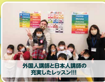
外国人講師と日本人講師の 充実したレッスン!!!

開講日 通年(木曜日) リトル 16:00~16:50(新年少~新年長) キッズA 17:00~17:50(新小学1・2年生) キッズB 18:00~18:50(新小学3・4年生) キッズC 19:00~19:50(新小学5・6年生) 受講料 7,150円/月 (テキスト代別)