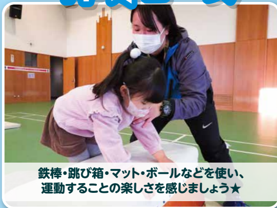
鉄棒・跳び箱・マット・ボールなどを使い、運動することの楽しさを感じましょう★

開講日 通年(火曜日) キッズA 16:00~16:40(新年少) キッズB 16:50~17:40(新年中~新年長) ジュニア 17:50~18:40(新小学1~6年生) 受講料 4,620円/月(教材費別)