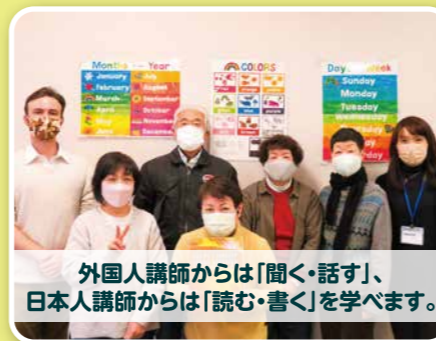
外国人講師からは「聞く・話す」、 日本人講師からは「読む・書く」を学べます。

開講日 通年(木曜日) 一般A 14:00~14:50(初級) 一般B 13:00~13:50(中級) 一般C 20:00~20:50(初級) ※全て高校生以上対象です 受講料 7,700円/月 (テキスト代別)