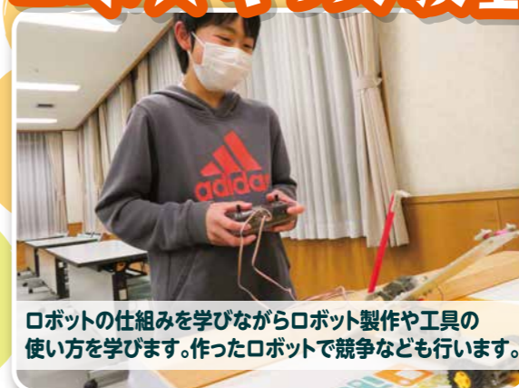
ロボットの仕組みを学びながらロボット製作や工具の 使い方を学びます。作ったロボットで競争なども行います。